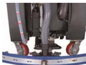
Interruptor elétrico para ajustar a pressão.