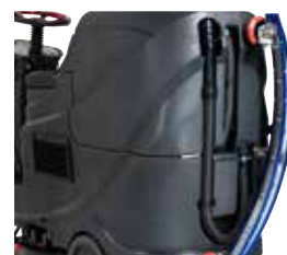
Suporte na parte traseira para colocar o bocal e desta forma passar em locais estreitos.