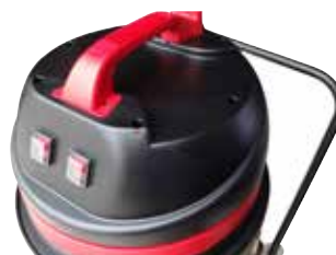
Fácil de usar graças à pega ergonômica com gancho para o cabo e dois botões independentes on/off.