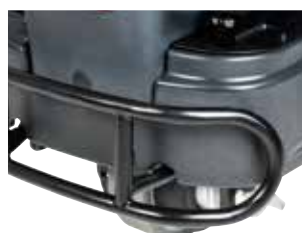
Pára-choques dianteiro de série que protege a máquina para uma maior vida útil.