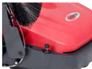
As escovas laterais podem ajustar-se individualmente apenas ao girar o manípulo.