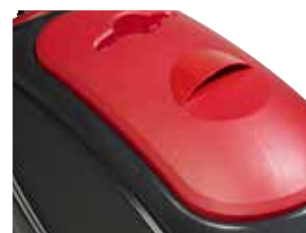
Limpeza simples do depósito de recuperação graças à grande abertura.