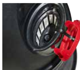
O enchimento de água é feito através de uma grande entrada de água com filtro e tampa protetora.