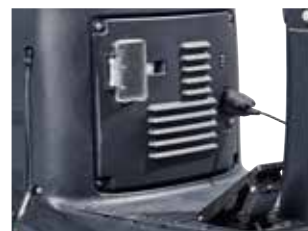
Um carregador a bordo integrado permite uma carga fácil da bateria em qualquer local.