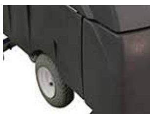
Rodas de tração cheias com espuma.