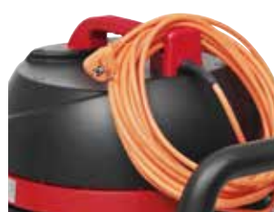
Suporte para cabo o que facilita o armazenamento.