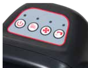
Painel de controlo fácil de usar com quatro funções principais.