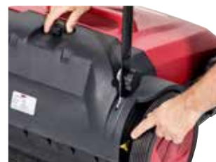
Escova principal ajustável.