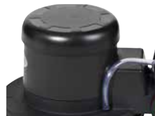
Motor silencioso e engrenagens.