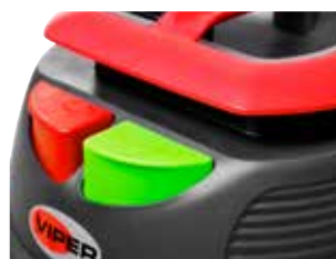
Botão ECO para ajustar a potência de aspiração e reduzir o ruído.