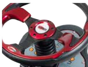
Painel intuitivo, botão tátil e menu fácil de usar.