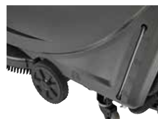
Fácil de manobrar e transportar: rodas grandes e fortes, para a máquina estar bem equilibrada.