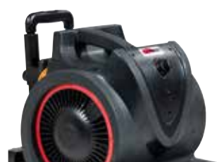
Pega para um fácil transporte.