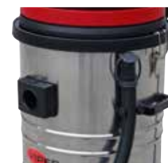
Mangueira de drenagem para fácil despejo do depósito.