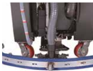
Interruptor elétrico para ajustar a pressão.