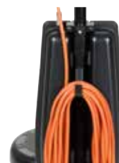
Gancho de metal robusto para enrolar o cabo e guardá-lo de forma segura.