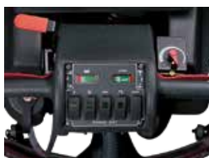
Painel de controlo intuitivo, com controlos fáceis de usar e painel com pressão das escovas.