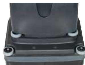
Também pode ser usada em zonas com sujidade difícil. Graças à grande pressão da escova até 68 Kg são obtidos bons resultados de limpeza.