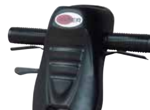
Controlos colocados ergonomicamente na pega.