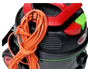
Suporte para fácil armazenamento do cabo.