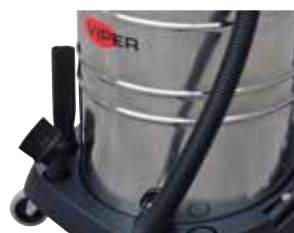
Fácil armazenamento dos acessórios.