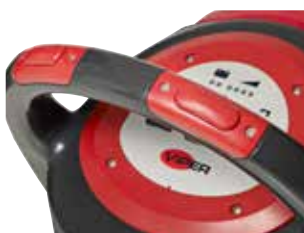
Botão de segurança integrado na pega. Cada botão pode ser acionado de forma independente.