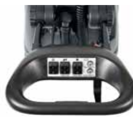
Pega ajustável e ergonómica