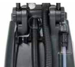
Mangueira de drenagem para facilitar o esvaziamento