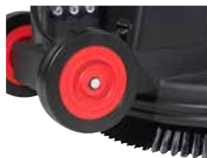
Rodas traseiras grandes que facilitam o transporte e asseguram uma boa manobrabilidade.