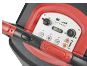
Painel de controlo intuitivo e com botões.