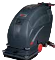
FANG24T / 26T / 28T