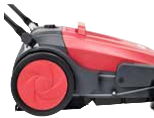
Rodas grandes que não deixam marcas.