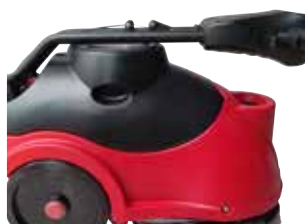
Pega dobrável para um fácil armazenamento.