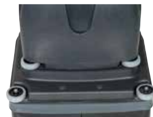
Também pode ser usada em zonas com sujidade difícil. Bom desempenho de limpeza.