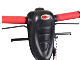
Pega ergonómica, ajustável em altura, botão central de segurança, manipulador para depósito de detergente.