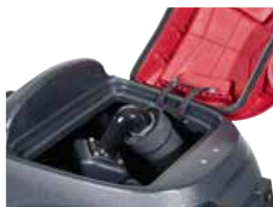
Fácil limpeza do depósito de recuperação de 73 l graças à sua grande abertura.