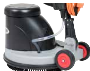
Potente, motor robusto e rodas traseiras grandes para facilitar o transporte.