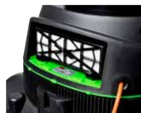
Filtro HEPA de série.