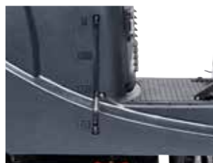
Indicador do nível de água visível no depósito.