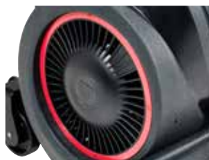
Ventilador de ar de alta qualidade com proteção do filtro.