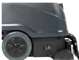
Rodas grandes para fácil transporte e melhor manobrabilidade