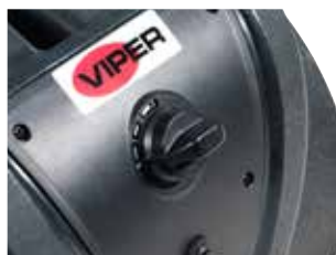
Motor de indução de 3 velocidades que permite poupar energia.