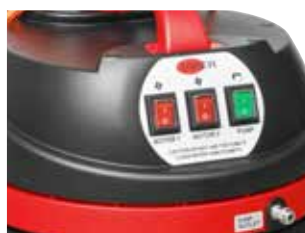
Função One-touch para uma operação fácil.