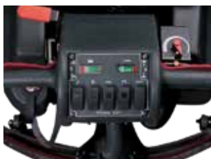
Painel de controlo simples com interruptor e indicador do nível de carga de bateria. A versão HD tem indicador de pressão.