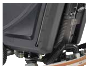
Indicador do nível de água com volume visível no depósito.