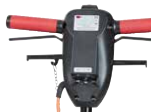
Pega ergonómica com ajuste da altura, bloqueio de segurança e manipulador para controlar o depósito de detergente.