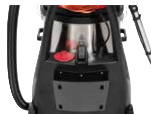
Depósito de água limpa integrado no chassis.